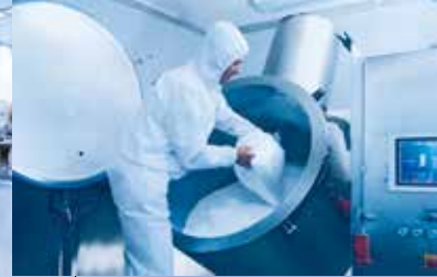
Moderne Mischanlagen für ein exakt definiertes Mischungsverhältnis.