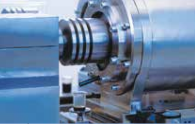
Prüfstand für Radialwellendichtungen mit PTFE-Dichtlippe zur Prüfung unterschiedlicher Parameter.