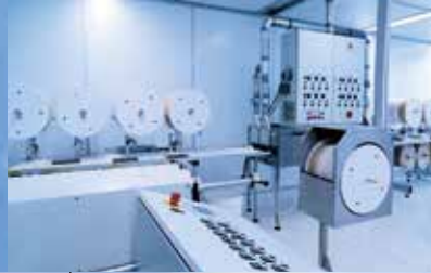
Produktion in Reinraumtechnik für höchste hygienische Anforderungen.