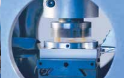
Prüfstand für Langzeitverschleißraten unterschiedlicher PTFE-Compounds auf verschiedenen Gleitpartnern.